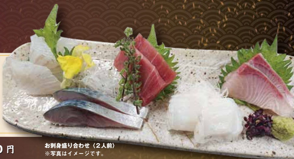
お刺身盛り合わせ (2人前) ※写真はイメージです。