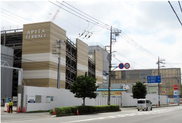
建設が進む「アピタテラス」(左)、右奥は米アップルの研究所「YTC」

「アピタ」が来年春に戻ってきます。パナソニック(旧松下通信工業)跡地の「網島SST(Tsunashimaサスティナブル・