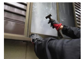
窓を割られて侵入されるケースが多い(写真はイメージ)

網島西と下田町を中心としたエリアで空き巣被害が相次いでいます。網島西と網島台では今年に入り公開されただけで未遂含め13件、下田町では1~3丁目で8月下旬から5件が連続。一戸建て・集合住宅ともに狙われており十分な警戒が必要です。