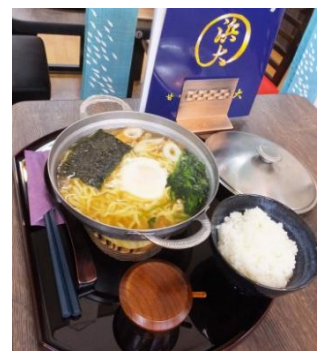
高知名物「鍋焼きラーメン」が新登場

毎日楽しめる食事メニュー(親子丼、牛カルビ丼、鍋焼きうどん、鍋焼きラーメン)のほか、ぜんざい、おしるこ、あんみつ、クリームあんみつ、季節のかき氷やパフェ、抹茶ミルクなどの和のスイーツやデザート類も充実。季節の新メニューも次々と生まれている「浜大」の日々の挑戦が、日吉の街のより一層の活性化につながるかに大きな注目が集まりそうです。