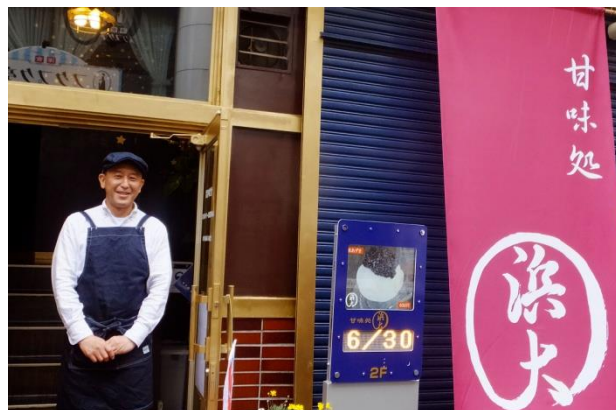
和風甘味・食事処「浜大(はまだい)」は6月30日にオープン (公式ツイッター: https://twitter.com/hamadai1942 )