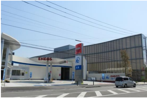
水素ステーション/スインテラスと米アップル研究所「YTC」

パナソニック(旧松下通信工業)工場跡地の再開発「綱島SST(Tsunashimaサステナブル・スマートタウン)」(綱島東4)が来春のまちびらきへ向けた動きが加速しています。すでに米アップルの研究所「YTC(横浜テクノロジーセンター)」が今年春に本格稼働したほか、燃料電池自動車の燃料である水素を充填するENEOS(エネオス)の「横浜綱島水素ステーション」と併設のショールーム「スインテラス」