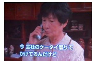
神奈川県警制作の映像より

日吉エリアに住む高齢層が“オレオレ詐欺”や“還付金詐欺”の犯人から集中的に狙われています。3月までの区内総被害金額のうち、6割超が日吉町と日吉本町で発生した事件によるもの。