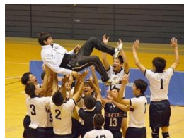
優勝を喜ぶ選手ら

慶應義塾高校(塾高)のバレー部は、11月12日に行われた神奈川県大会の決勝戦で県立荏田(えだ)高校に2-0でストレート勝ちし、初優勝を飾るとともに来年1月4日から都内で行われる全国大会「春高バレー」への初出場が決まりました。