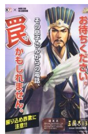
港北署とコーエーは啓発ポスターを制作

「振り込め詐欺」の被害が急増しています。9月末までの被害金額は高田西の3件約3500万円を筆頭に日吉本町で3件約600万円、箕輪町が1件約200万円にのぼり、その後も10月6日に日吉2丁目息子名乗る男に約200万円をだまし取られるなど、区内では架空請求詐欺や還付金詐欺を含め高齢層を狙う悪質な事件が続発中。警戒が必要です。